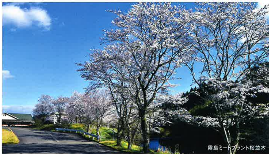
霧島ミートプラント桜並木